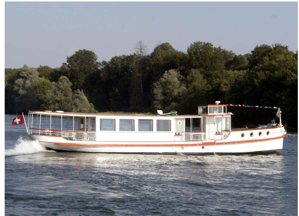
Motorschiff Konstanz, erbaut 1925

Bei Fragen wenden Sie sich bitte an: Denkmalpflege Schaffhausen Fachstelle des Kantons und der Stadt Beckenstube 11 8200 Schaffhausen Tel. 052 632 73 25