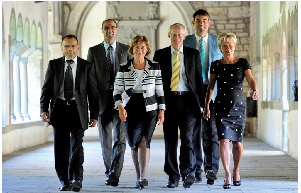
Die Mitglieder des Schaffhauser Regierungsrates 2009 – 2012 (von links)

Der Regierungsrat ist die oberste leitende und vollziehende Behörde (Exekutive) des Kantons Schaffhausen. Er ist eine Kollegialbehörde, die aus fünf Mitgliedern besteht: den Regierungsrätinnen und den Regierungsräten. Diese werden nach dem Majorzverfahren alle vier Jahre vom Volk gewählt. Der Regierungsrat erfüllt alle Aufgaben, die ihm durch Verfassung oder Gesetz zugewiesen sind. Dem Staatsschreiber kommt dabei «beratende Stimme» zu.